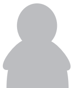
共同合作 家庭律师